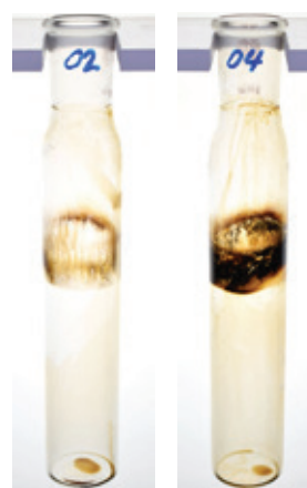
TRAXON SYNTHETIC MTF 75W-80 КОНКУРЕНТ А, СИНТЕТИЧЕСКОЕ МАСЛО, 75W-80

В испытании DKA на окисления эффективность продукта оценивалась путем измерения повышения вязкости масла в течение определенного времени (чем ниже столбик после 192 часов, тем лучше). По сравнению с двумя ведущими конкурентами продвинутой состав масла TRAXON Synthetic MTF 75W-80 лучше препятствует разложению и загустеванию масла.